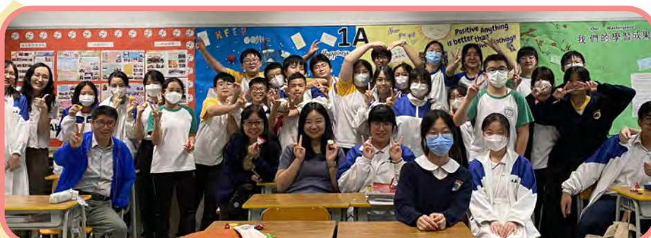
大哥哥大姐姐中一關顧活動——停不了的愛