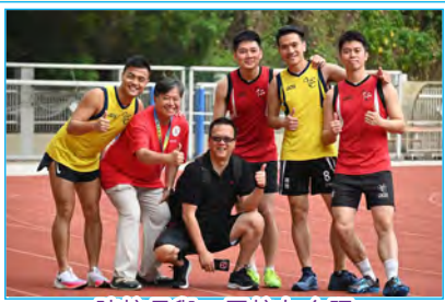
陳校長與一眾校友合照