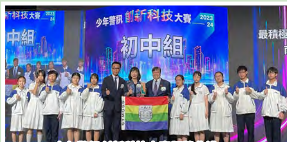
少年警訊創新科技大賽頒獎典禮

學生在STEAM領域的表現越見優秀，屢創佳績。在2023/24少年警訊創新科技大賽，本校10位中二級學生獲頒嘉許獎，本校更榮獲最積極參與少訊學校支會獎。此外，在2024「飛向北京·飛向太空」全國青少年航空航天模型教育競賽香港區選拔賽，本校榮獲多個大獎，包括水火箭 35 米定點打靶賽（中學女子組）冠軍、手擲滑翔機直線距離賽（黃鸝）（中學女子組）冠軍、一級橡筋動力飛機競時賽（雷鳥）（中學女子組）冠軍、橡筋動力撲翼飛機競時賽（神翼）中學組冠軍。學生的成就充分肯定本校STEAM教育的成果，我們將繼續努力，為學生的未來奠定成功的基礎。