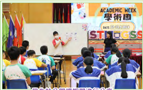
學生於公開課期間進行分享

學術周的主要活動有三項：「學習成果分享會」、「南官好書推介」、「公開課」。「學習成果分享會」提供平台，讓同學分享在「走出教室」活動的習得，營造同儕欣賞互勉的文化。「南官好書推介」則屬跨學科活動，同學自選圖書，設計短片進行推介，推動校園閱讀風氣。此外，本校中、英、數、地理及中國歷史科老師公開課堂，邀請家長到校觀摩交流，加深了他們對子女學習情況的了解。中華基督教會蒙黃花沃紀念小學的老師團隊亦應邀蒞臨出席中史科公開課堂，除了促進中、小學之間的交流外，對課程設計亦大有裨益。