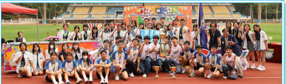
全場總冠軍(藍社)與主禮嘉賓合照