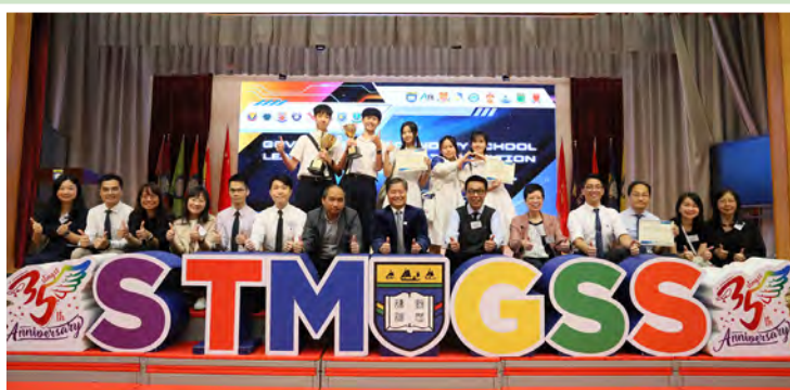
香港官立中學人工智能學習圈比賽暨頒獎典禮