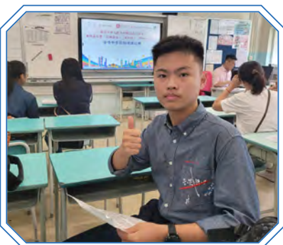
「認識憲法、《基本法》——與法治同行」全港中學校際演講比賽2024準決賽