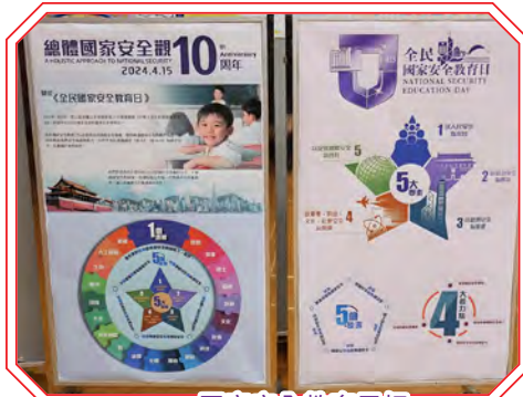
國家安全教育展板