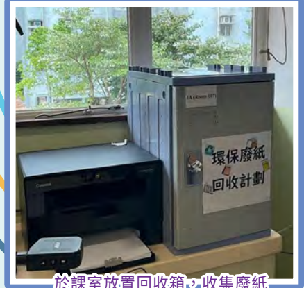
於課室放置回收箱，收集廢紙