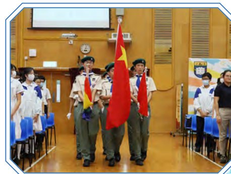
升旗典禮，升旗隊進場