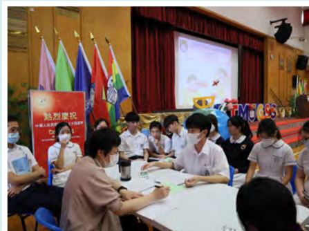
中六同學模擬大學面試