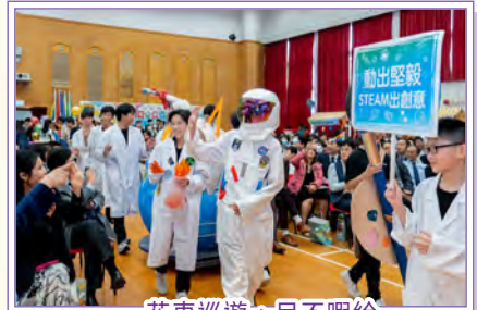
花車巡遊，目不暇給