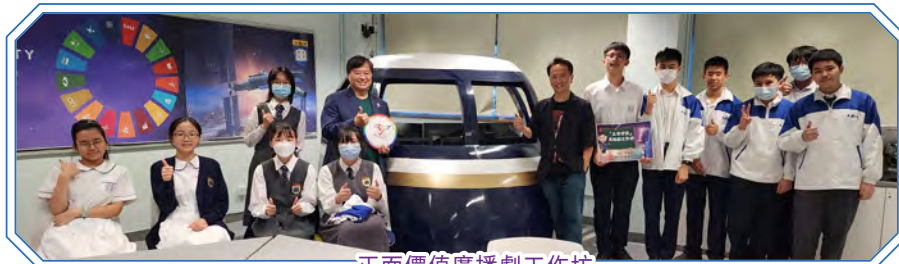
正面價值廣播劇工作坊

本年度透過不同的活動，包括「國家憲法日網上問答比賽」、「香港盃外交知識競賽」、「國慶中秋慶祝活動」、「正面價值廣播劇工作坊」等，讓學生逐步認同及建構自己的國民身份及培養正確的價值觀。為了提升學生的國家觀念，每週均舉行升旗典禮及國旗下的講話，增加學生對國家的認識和歸屬感，期望學生努力學習、為國家和香港作出貢獻。