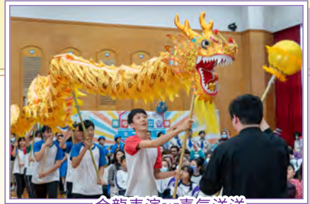
金龍表演，喜氣洋洋