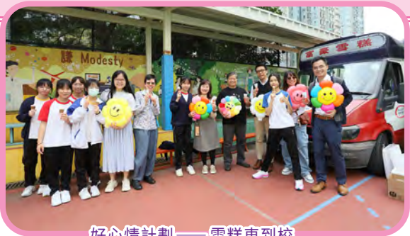
好心情計劃——雪糕車到校