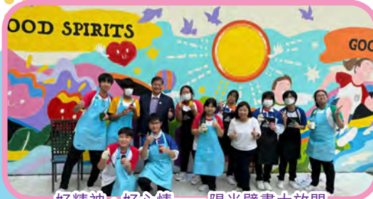
好精神·好心情——陽光壁畫大放閃

此外，為了讓學生建立準時到達課室的好習慣，本年度推行「5分鐘轉堂運動」，由兩位班長有秩序地帶領同學於5分鐘內到達課室或特別室上課，希望同學能養成守時的習慣，得到他人的讚賞和尊重，提升成就感及自信心。