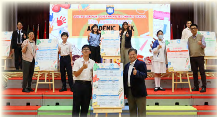
陳校長帶領學務組老師及學生主持學術周的揭幕儀式