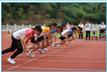
健兒專心致志，整裝待發