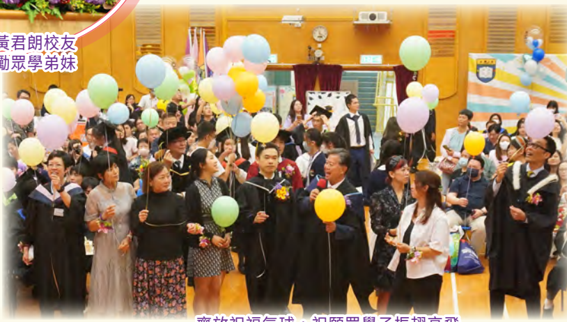
齊放祝福氣球，祝願眾學子振翅高飛