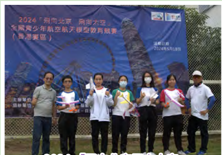
2024「飛向北京飛向太空」青少年航空航天模型教育競賽（香港區）

本校一直致力於推廣STEAM教育，把STEAM教育納入初中的正規課程。透過多個專題，例如智慧城市專題研習、科學鑑證和人工智能等，提高學生的創造力和解難能力，讓學生了解並掌握最新的科技知識和技能，更好地應對未來的挑戰。