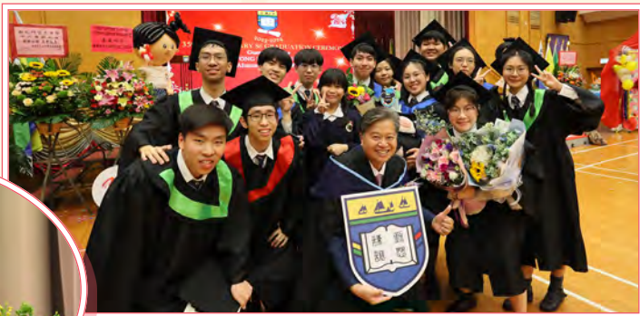
畢業生獲頒授畢業文憑，邁向人生新里程