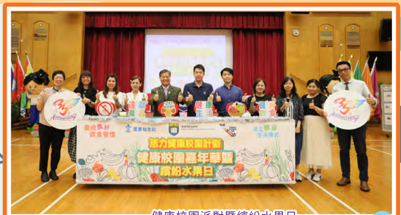
健康校園派對暨繽紛水果日