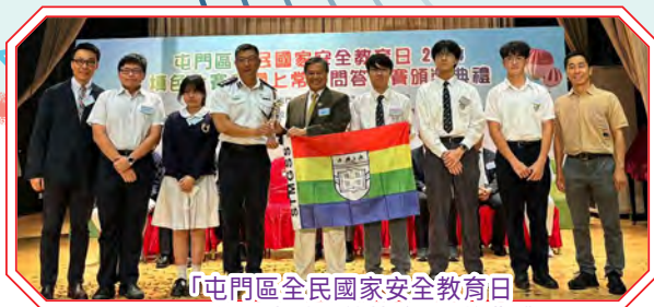
「屯門區全民國家安全教育日2024網上常識問答比賽」頒獎典禮

此外，本校積極鼓勵家長參加與國安教育相關的活動，例如國情教育——國家安全教育活動簡介、「中國傳統藝術飛躍舞台大匯演2024」，期望家長從中認識國情和感受中華文化，支持學校推行國安教育，協助培養子女對國家安全及國民身份的認同。