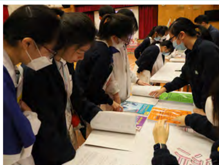
中三同學參加選科知多D——選修科博覽