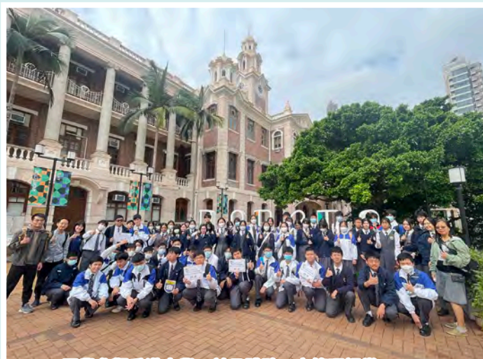
同學參觀香港大學，並且體驗工商管理課堂

生涯規劃教育組致力為不同學習階段的學生舉辦活動，為未來做好準備。中一至中三級重點是「自我認識與發展」，舉辦「我想…我是…自我認識」和「歷情體驗——生活反思」工作坊。此外，舉辦「訂立目標」和「中三升中四選科知多D」工作坊，讓初中學生訂立目標，瞭解選科資訊。中四至中六級則以「職業探索、規劃與管理」為重點，舉辦「從業員分享」、「模擬放榜」、「大學生體驗日」等活動，並透過參觀職場、工作實習和大灣區交流團、參觀大專院校等，為中六學生提供個人升學輔導，協助他們編製學生學習概覽。本組亦為家長提供講座和資訊，讓他們能更有效地協助子女進行生涯規劃，共同迎接未來的挑戰。