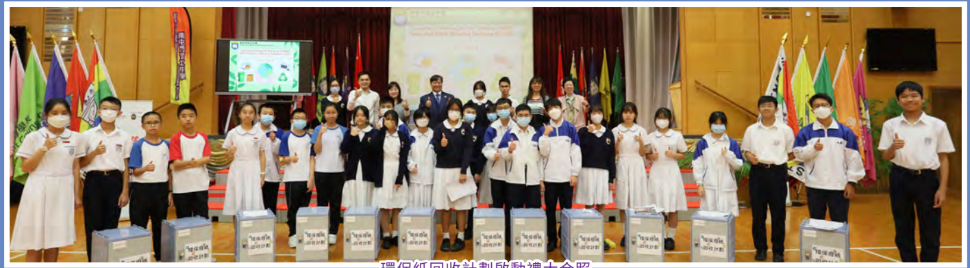
環保紙回收計劃啟動禮大合照