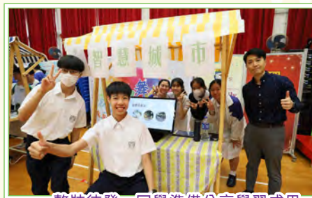
整裝待發，同學準備分享學習成果