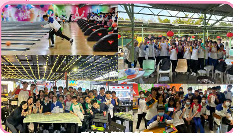
本班好心情放閃大行動