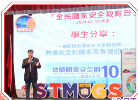
「全民國家安全教育日2024」全校集會，校長、老師、學生齊齊進行分享