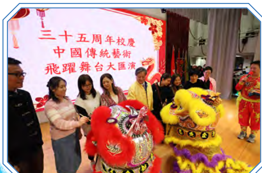
家長參與「中國傳統藝術飛躍舞台大匯演2024」活動