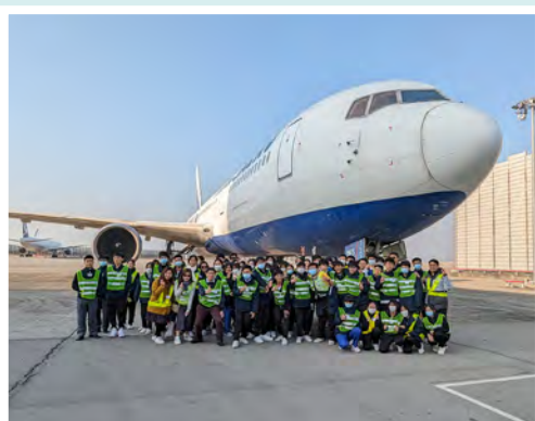
學生參觀香港國際航空學院及香港國際機場，了解機場日常運作及航空業的發展。