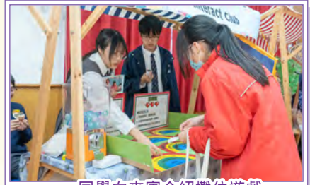
同學向來賓介紹攤位遊戲