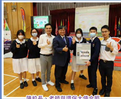
陳校長、老師與環保大使合照

環境教育組致力宣揚環保概念，提升學生保護環境的正面價值觀。本年度推行「綠在南官——班制環保紙回收比賽」計劃，各班回收廢紙，從源頭減少廢物的產生。比賽共分七輪進行統計，最終收集超過400公斤廢紙。當中，5D班以超過90公斤廢紙的回收量成為全校之冠，獲得參加香港海洋公園全方位學習之旅的機會，從中認識人與自然和諧共處和環境保育的重要性。再次恭喜5D班及感謝各班的積極參與。