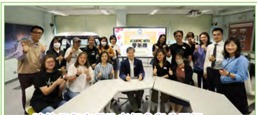
陳校長與家長及老師參與公開課