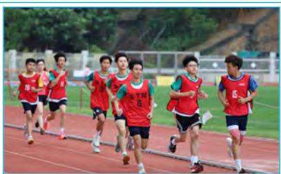
長跑健兒堅毅不屈