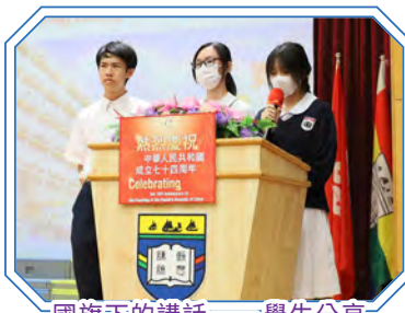
國旗下的講話——學生分享