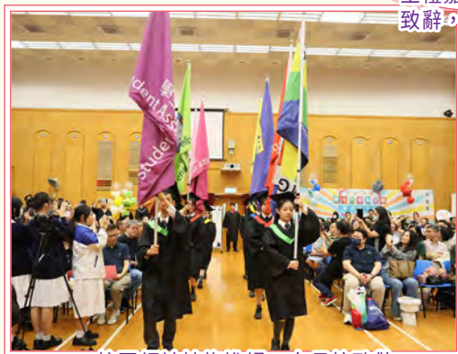
校園領袖持旗進場，向母校致敬